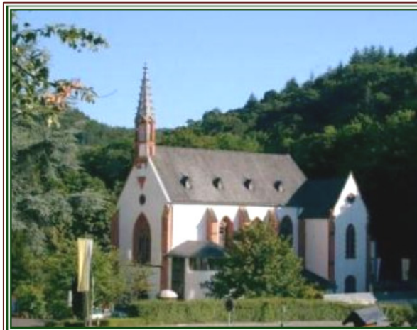
Wallfahrtskirche zur „Schmerzhafte Muttergottes“

Marienthal, dieser besondere Ort der Stille und Begegnung, zählt zu den ältesten Wallfahrtsorten in Deutschland. Kloster und Wallfahrtskirche liegen am sonnigen Südhang des Taunus, im schönsten Teil des Rhein-gau's. Die Stille und die Schönheit der Natur geben Raum zum Durchatmen, zum Entspannen und zur Besinnung. Rund ums Kloster, kann man die Vielfalt von Gottes Schöpfung erahnen und in Gebet und Meditation seine Gegenwart im eigenen Inneren und in der Natur entdecken.